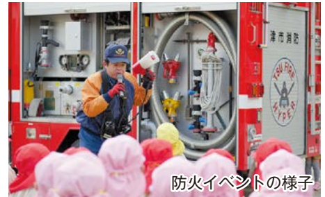
防火イベントの様子

期間中は、自治会や事業所、学校等で、防火に関する講話や消火器の取り扱いなどの訓練が行われます。火災を出さない地域づくりのため、ぜひ積極的にご参加ください。