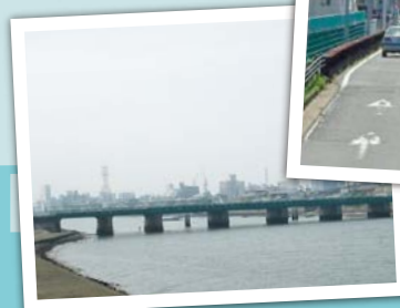
通称「近鉄道路」と呼ばれ、重要な幹線として利用