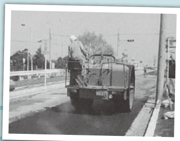
昭和36年、廃線(鉄道橋から道路橋へ)