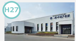
H27 場外発売場BTS※名張開設