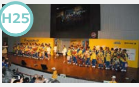
H25 SGチャレンジカップ開催