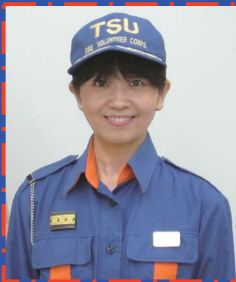
津市消防団津方面団デージー分団