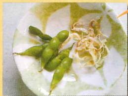
レシピ提供：NPO マザーズエイド 山本