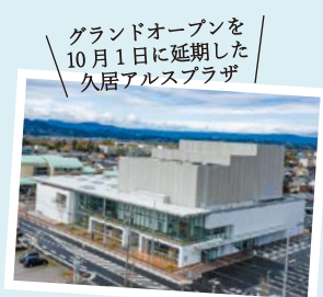
グランドオープンを10月1日に延期した久居アルスプラザ