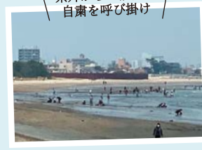
県外からの訪問の自粛を呼び掛け