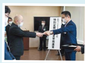
4月22日 新型コロナウイルス感染症特別定額給付金等推進室を設置