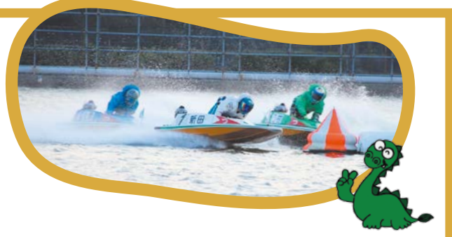
モーターボート競走事業の売上金と繰出金 (億円)

経営管理課 ☎224-5105 FAX 222-8210 財政課 ☎229-3124 FAX 229-3388