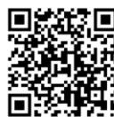
ごみ分別 ガイドブック