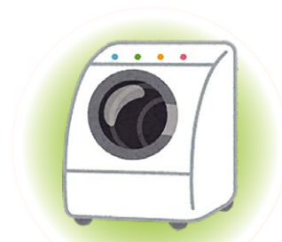
洗濯機 衣類乾燥機