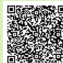
収集運搬許可業者