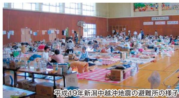
平成19年新潟中越沖地震の避難所の様子

理者、行政の三者が相互に協力し、地域の実情に応じたマニュアルを作成するなど、円滑な避難所運営ができる体制づくりを行いましょ。