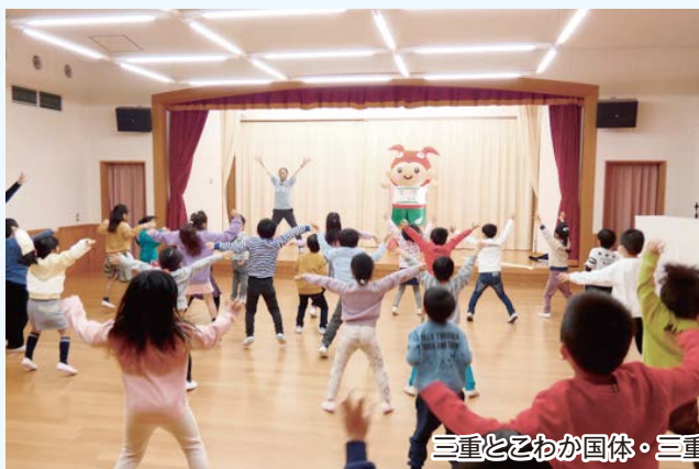
三重と乙わか国体・三重と乙わか大会PIRの様子