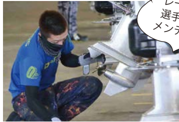
エンジンを整備する選手