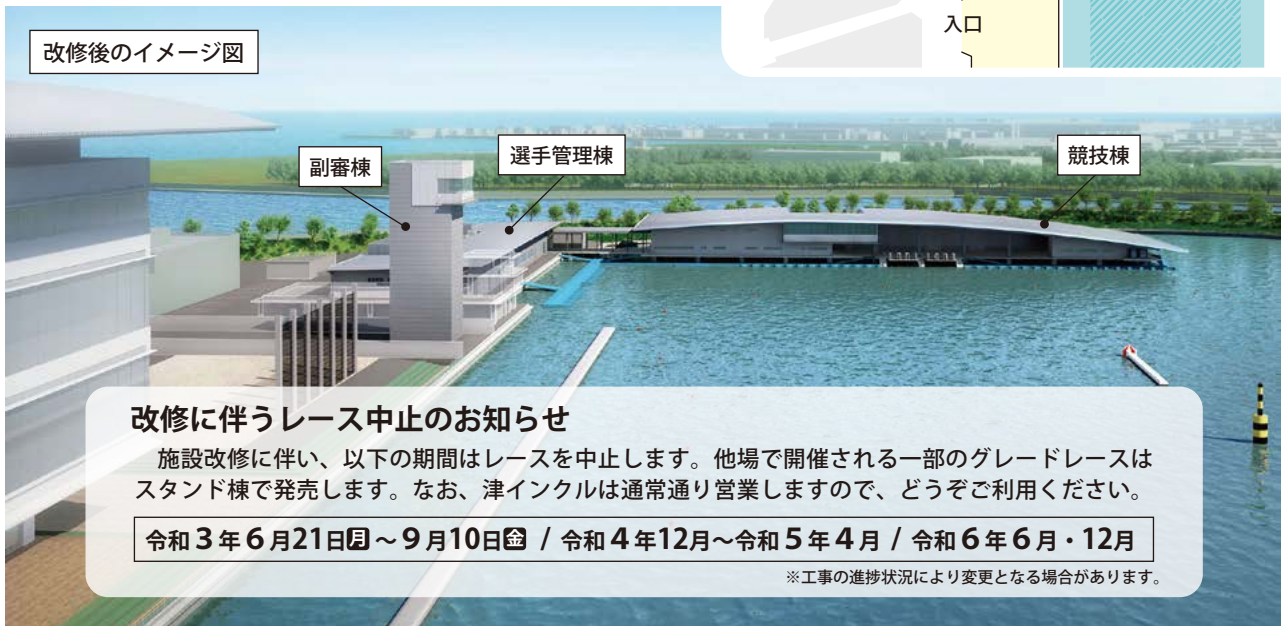
改修後のイメージ図