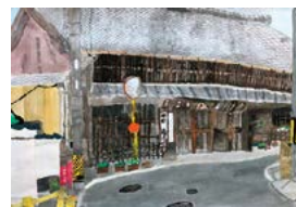
第1回津市こども景観絵画コンクールの最優秀賞作品

新型コロナウイルス感染症の拡大防止のため、広報津に掲載のイベント等は中止または延期の可能性が あります。参加される場合は各問い合わせ先へ確認をお願いします。