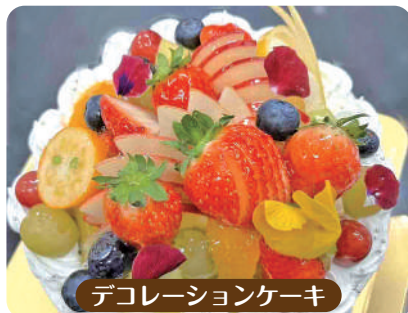
デコレーションケーキ