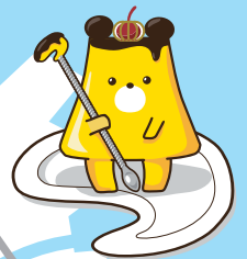
「ぷりんっ君」 津市物産振興会スイーツ部会 公式キャラクター