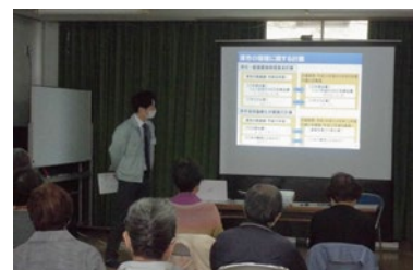
ごみダイエット塾の様子

申し込み 申込用紙を直接窓口または郵送、ファクス、Eメールで環境政策課(〒514-8611 住所不要、TEL 229-3139@city.tsu.lg.jp)へ、または各総合支所地域振興課窓口へ ※申込用紙は津市ホームページからダウンロード可