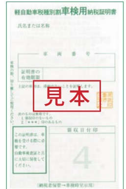
軽自動車税種別割納税通知書(車検用納税証明書部分)

なお、軽自動車税種別割納税通知書には、これまで通り右端に車検用納税証明書を添付します。また、従来の紙による車検用納税証明書も市本庁舎税務総合窓口、各総合支所市民福祉課(市民課)などで発行します。