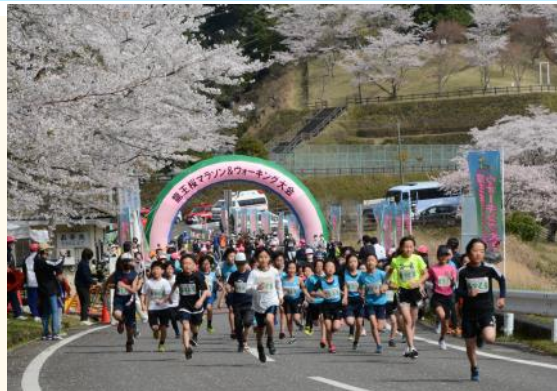
3kmマラソン小学3年生以上