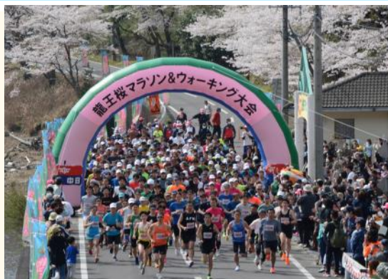
10kmマラソン中学生以上

4月2日(日)、錫杖湖水荘前をスタート・ゴールとして龍王桜マラソン&ウォーキング大会が4年ぶりに開催され、青空と満開の桜が咲き誇る錫杖湖畔にいろどりを添えました。