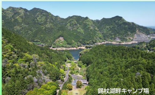
錫杖湖畔キャンプ場

夏の休日は、ご家族や仲間と落合の郷でバーベキュー、錫杖湖畔キャンプ場でデイキャンプはいかがですか？