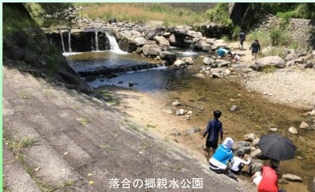
落合の郷親水公園