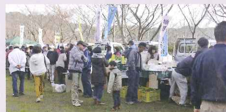
昨年度の収穫祭の様子