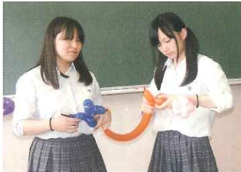
バルーンアート練習風景