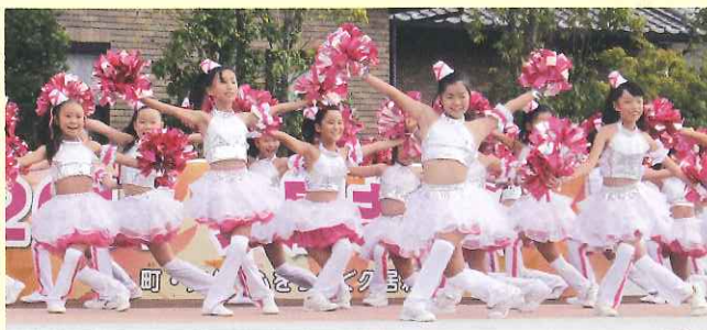
昨年度の本祭ステージの様子