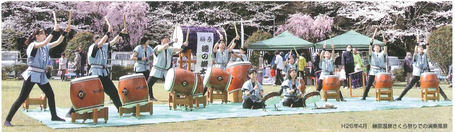
H26年4月 榊原温泉さくら祭りでの演奏風景

自主練習1回を含め週2回のペースで、仕事や学校が終わってから練習を行います。また、出演当日は演奏の時間以外に太鼓の準備や終了後の反省会などもあり、1日のほとんどの時間が取られます。