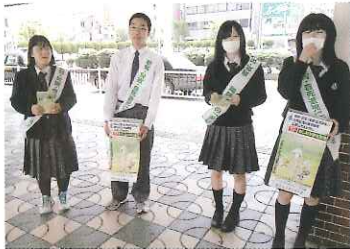
津駅での募金風景

今年は、津南警察署の依頼により、振込み詐欺被害予防のアナウンス録音をし防犯のCDを作成するなど、いろいろな形のボランティア活動をしています。