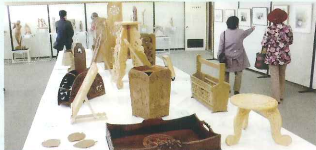
昨年度美術展の様子