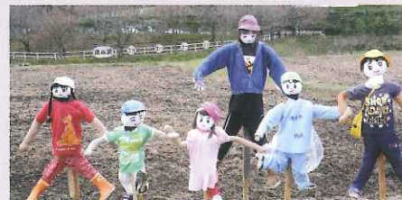
昨年度のかかしコンテスト入賞作品