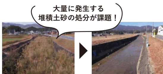
堆積土砂の撤去前・撤去後(準用河川大谷川)