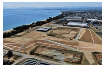
香良洲高台防災公園

中勢バイパスの掘削土や雲出川などの堆積土砂を受け入れ、事業の経費削減と促進を担ってきましたが、令和4年度に総受入土量約75万㎡に達したため受け入れを終了しました。