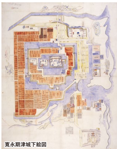
寛永期津城下絵図

そして、それまで海沿いを通っていた伊勢街道を城下を通す形にしたことにより、津の町は宿場町としても機能するようになります。その道筋を、江戸橋から部田(現在の栄町周辺)を通して塔世川(安濃川)を渡り、城下から岩田橋を渡って東南に向かうルートに変更することで参宮客の滞在を図りました。大規模な市街地形成と城下への移転を促進するため、津藩は、総額2,000両相当(現在の約2億円)の移転料を町民に与え、新たなまちづくりを図ったのでした。