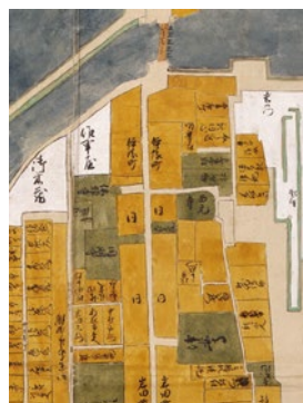
享保期津絵図(部分)

高虎入府後の城郭整備に合わせて開始された城下町整備は、約90年にわたって範囲を拡大して行われ、3代藩主藤堂高久の治世下で完成に至ります。後の享保期(1716~1736年)の城下絵図には、八町や藤枝、新東町も描かれており、当初より城下が拡大したことを如実に示しています。