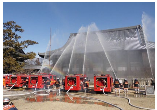
昨年の専修寺での防火訓練

文化財は、私たちみんなの共有の財産です。地域一体となり、日頃から文化財の保護に努めましょう。