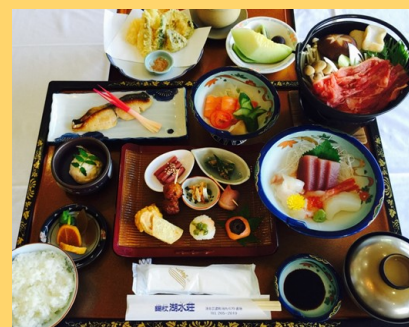
季節によって料理の内容が異なる場合があります