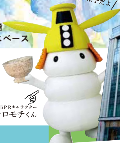
津市PRキャラクター シロモチくん