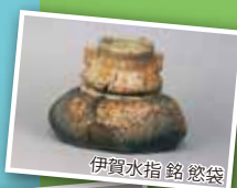
伊賀水指 銘 慾袋