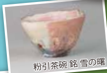
粉引茶碗 銘 雪の囀