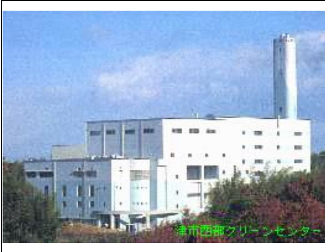
津市西部クリーンセンター

大分類 11 供給処理施設 分野 O 供給処理施設 区分 01 ごみ処理場 施設番号 7102 複数施設 個体記号 Y 母棟 建物記号 W 複合建物 部分記号 Y 主部分 所管課等 環境部 環境施設課 TEL 059-229-3127