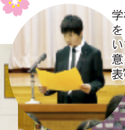
学校で学んだことを大切に、前を向いて歩いていく決意を語った児童代表の6年生