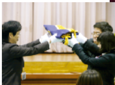
校旗を返納し、明治8年からの歴史に幕