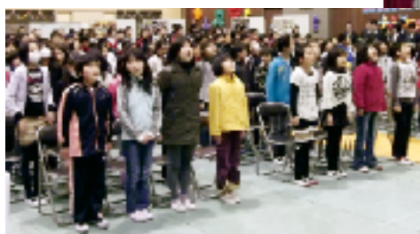
元気いっぱいに校歌を歌う子どもたち