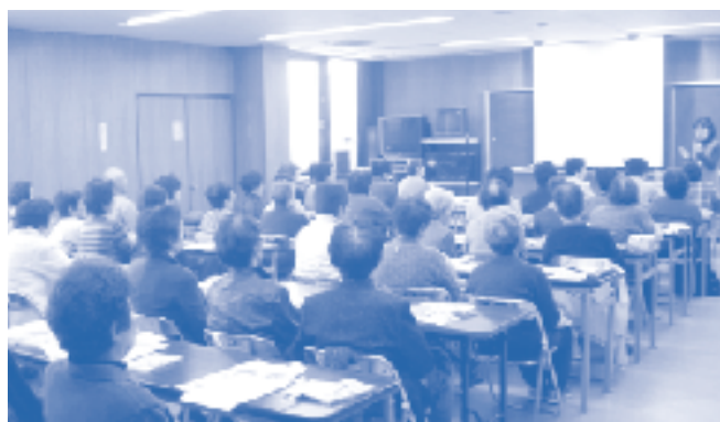
▲昨年の出前講座の様子