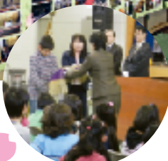
慣れ親しんだ校旗とお別れ