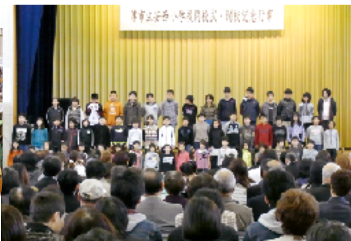
安西小学校での思い出を全校児童で群読