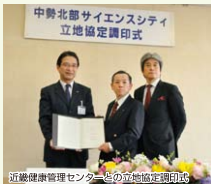
近畿健康管理センターとの立地協定調印式

3月8日に、健康診断や生活習慣病予防研修などを手掛けられている財団法人近畿健康管理センターが、3月30日には、全国的な物流ネットワークを有する福山通運株式会社を含む2社が、中勢北部サイエンスシティへの進出を決めていただきました。