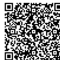
スマートフォン用

※ いただいた情報は、本事業の実施のために使用するほか、提供を希望されない参加者を除いて、本セミナー参加事業者へも情報提供を行います。